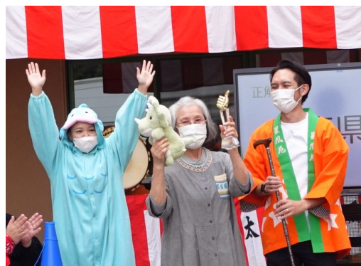
▲ご長寿クイズで優勝しました！