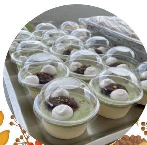
◀◀入居者様ご家族様には無料で提供しました♪