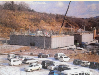
ケアハウス星風苑建設工事着工