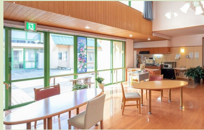
▲共同スペース お食事や団らんの空間です。