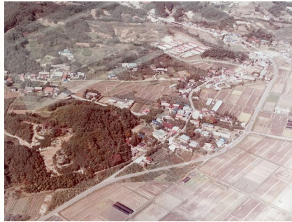
昭和58年月舘町御代田地区上空より