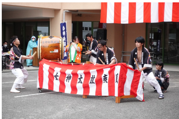
▲女神太鼓「疾風」によるオープニングアクト

10月5日に秋祭りを行いました。今年のご家族様も参加され、沢山の笑顔が見られました。オープニングは迫力のある太鼓演奏、職員のダンスに入居者様参加のクイズでとても盛り上がり、最後の盆踊りでは入居者様も一緒に踊っていました。