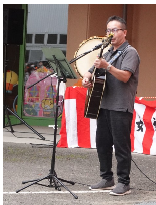
▲職員によるギターライブ