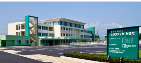
▲厚生会クリニック