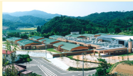
鉄筋コンクリート造 平屋建て 敷地17,811㎡／延床5,228㎡