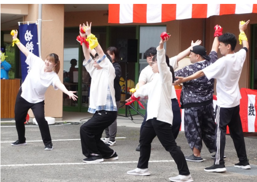
▲職員によるダンス披露♪